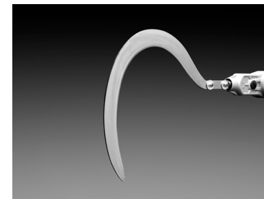
Cuchilla tipo Hoz