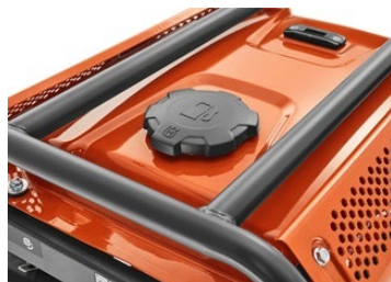
Tapón de combustible externo para reabastecimiento de combustible

Tapón de combustible externo para reabastecimiento de combustible fácil